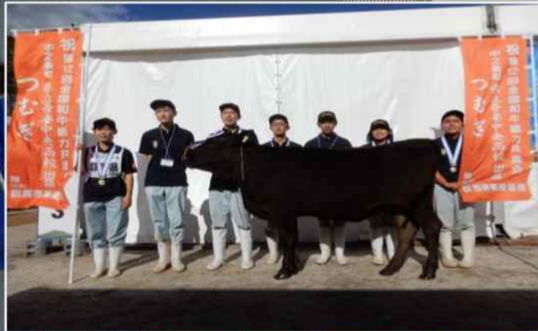
全国和牛能力共進会